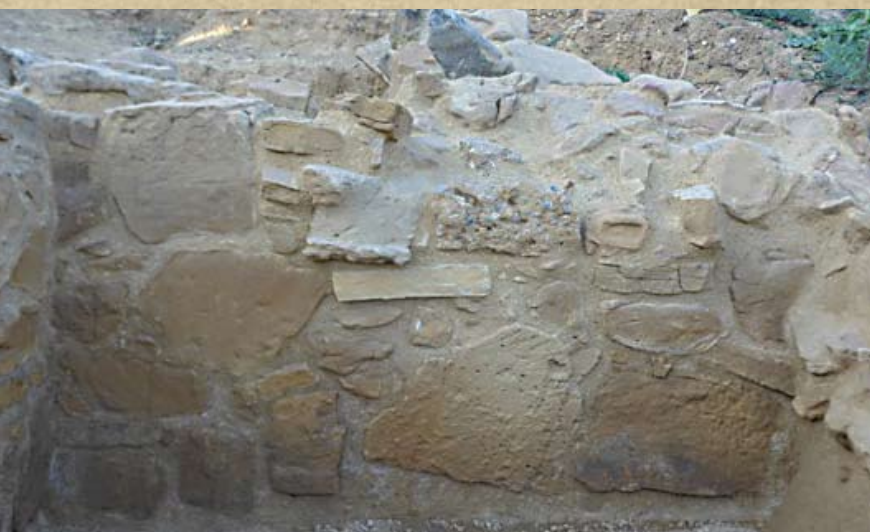
Εικ. 13. Τοίχος Β2 στο πρανές με οικοδομικά κατάλοιπα ΝΑ του ελληνιστικού Τελεστηρίου (μετά τη συντήρηση)

χώθηκε το αρχαϊκό Τελεστήριο, προκειμένου να προστατευθούν τα έδρανα από τις δυσμενείς καιρικές συνθήκες.