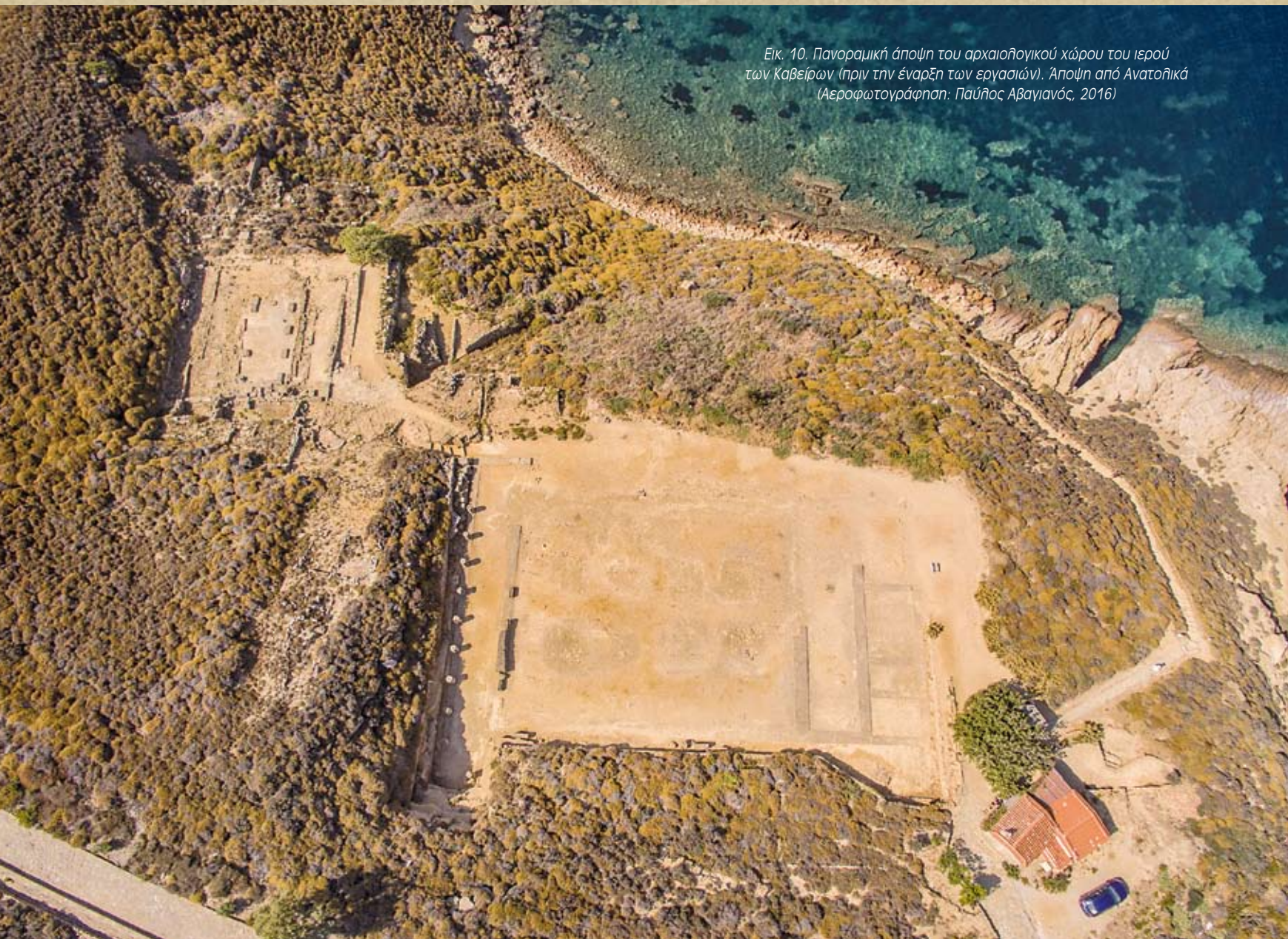
Εικ. 10. Πανοραμική άποψη του αρχαιολογικού χώρου του ιερού των Καβείρων (πριν την έναρξη των εργασιών). Άποψη από Ανατολικά (Αεροφωτογράφιση: Παύλος Αβαγιανός, 2016)

Το 1991 ήταν η τελευταία χρονιά που πραγματοποιήθηκε στο χώρο ανασκαφική έρευνα από την Ιταλική Αρχαιολογική Σχολή στην Αθήνα. Τότε κατα-