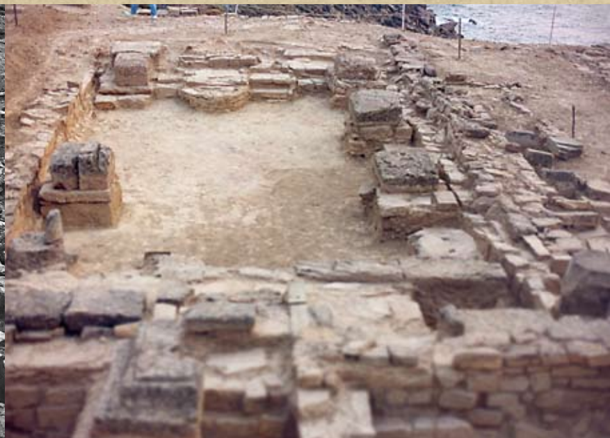
Εικ. 8 -9. Το Αρχαϊκό Τελεστήριο. Άποψη από Ανατολικά (1984 - 1985)