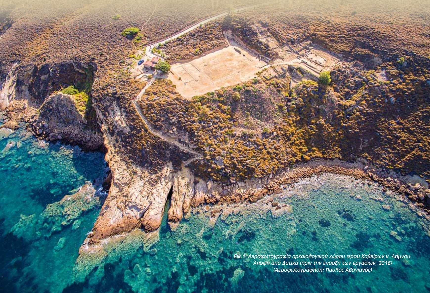
Εικ. 1. Αεροφωτογράψια αρχαιολογικού χώρου ιερού Καβείρων ν. Λήμνου. Άποψη από Δυτικά (πριν την έναρξη των εργασιών, 2016)

Οι Κάβειροι, σύμφωνα με την φιλολογική παράδοση, ήταν παιδιά ή εγγόνια του Ηφαίστου με Πελασγική, Φρυγική ή Φοινικική προέλευση και λατρεύονταν ως δαίμονες της φωτιάς και της μεταλλουργίας, της