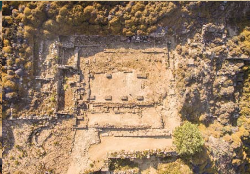
Εικ. 5. Αεροφωτογραφία του υστερορωμαϊκού Τελεστηρίου. Άποψη από Βόρεια

Το υστερορωμαϊκό Τελεστήριο (εικ. 5-6, η ηγεγόμενη «βασιλική») βρίσκεται στο νότιο πλάτωμα και είναι θεμελιωμένο πάνω στο υποκείμενο αρχαϊκό Τελεστήριο. Αμελέστερο και αρκετά ταπεινότερο σε διαστάσεις, μιμείται την κάτοψη του ελληνιστικού Τελεστηρίου, καθώς και τη λειτουργικότητά του. Η είσο-