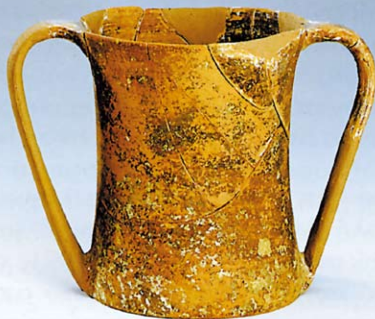
Εικ. 14. Πρωτοθημιακοί κώνθοροι από το ιερό των Καβείρων. 8 ος - 6 ος αι. π.Χ.