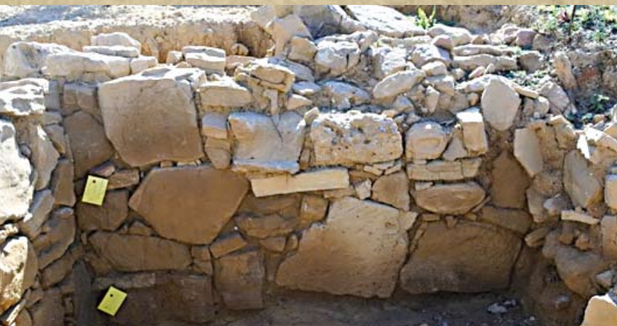
Εικ. 12. Τοίχος Β2 στο πρανές με οικοδομικά κατάλοιπα ΝΑ του ελληνιστικού Τελεστηρίου (πριν τη συντήρηση)