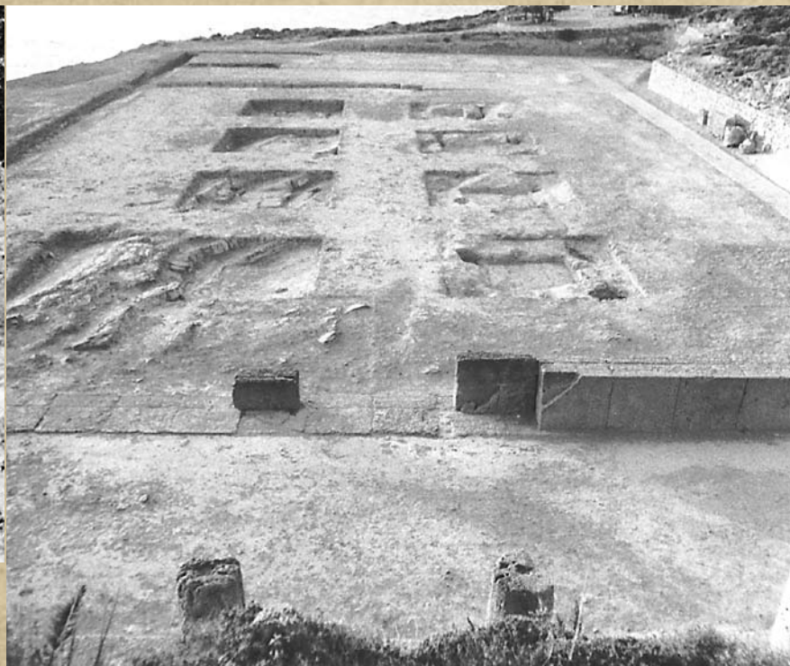
Εικ. 3. Το Ελληνιστικό Τελεστήριο μετά τις ανασκαφές της Ιταλικής Αρχαιολογικής Σχολής. Άποψη από Νότια (1987, ΙΑΣΑ)