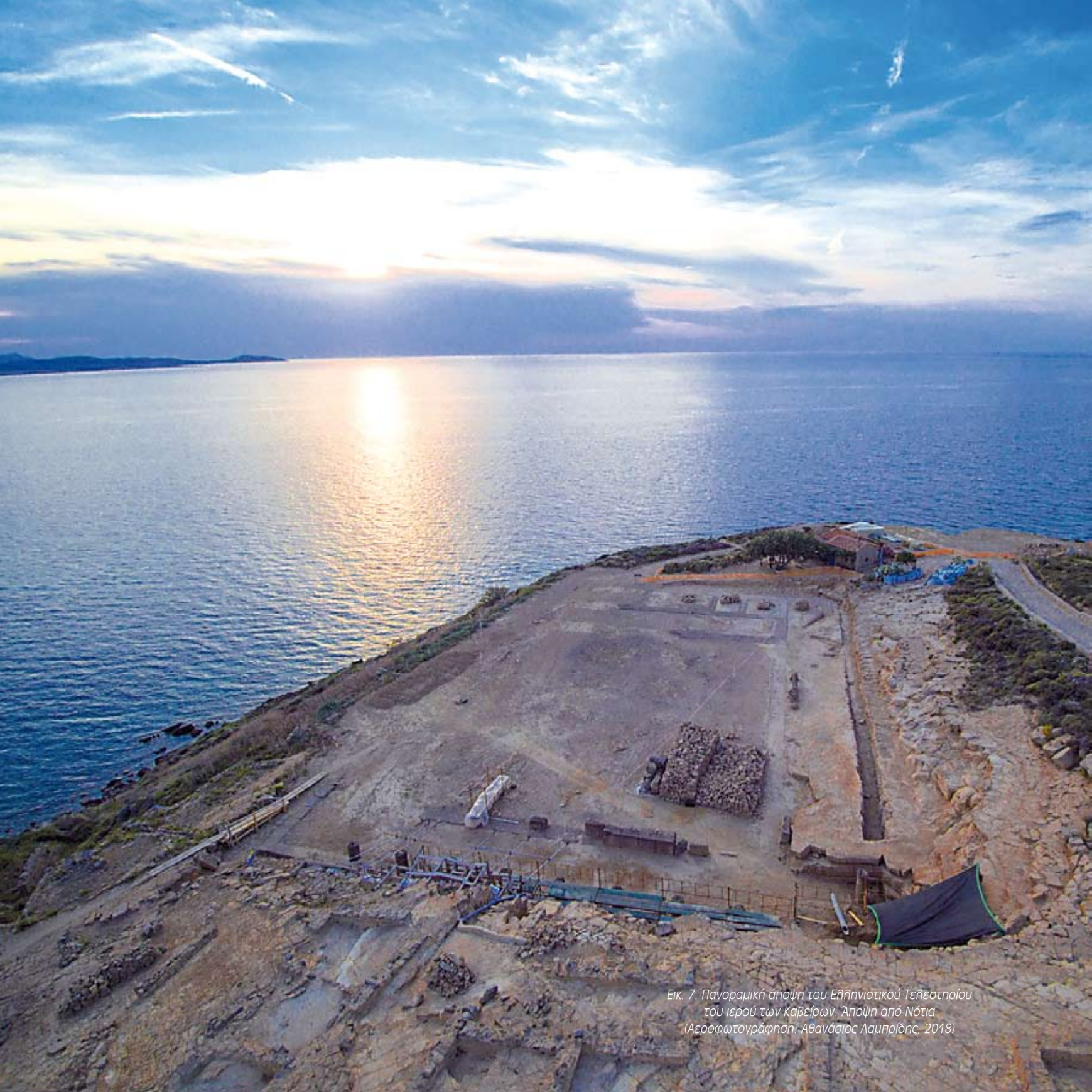
Εικ. 7. Πανοραμική άποψη του Ελληνιστικού Τεκτεσθρίου του ιερού των Καβείρων. Άποψη από Νότια