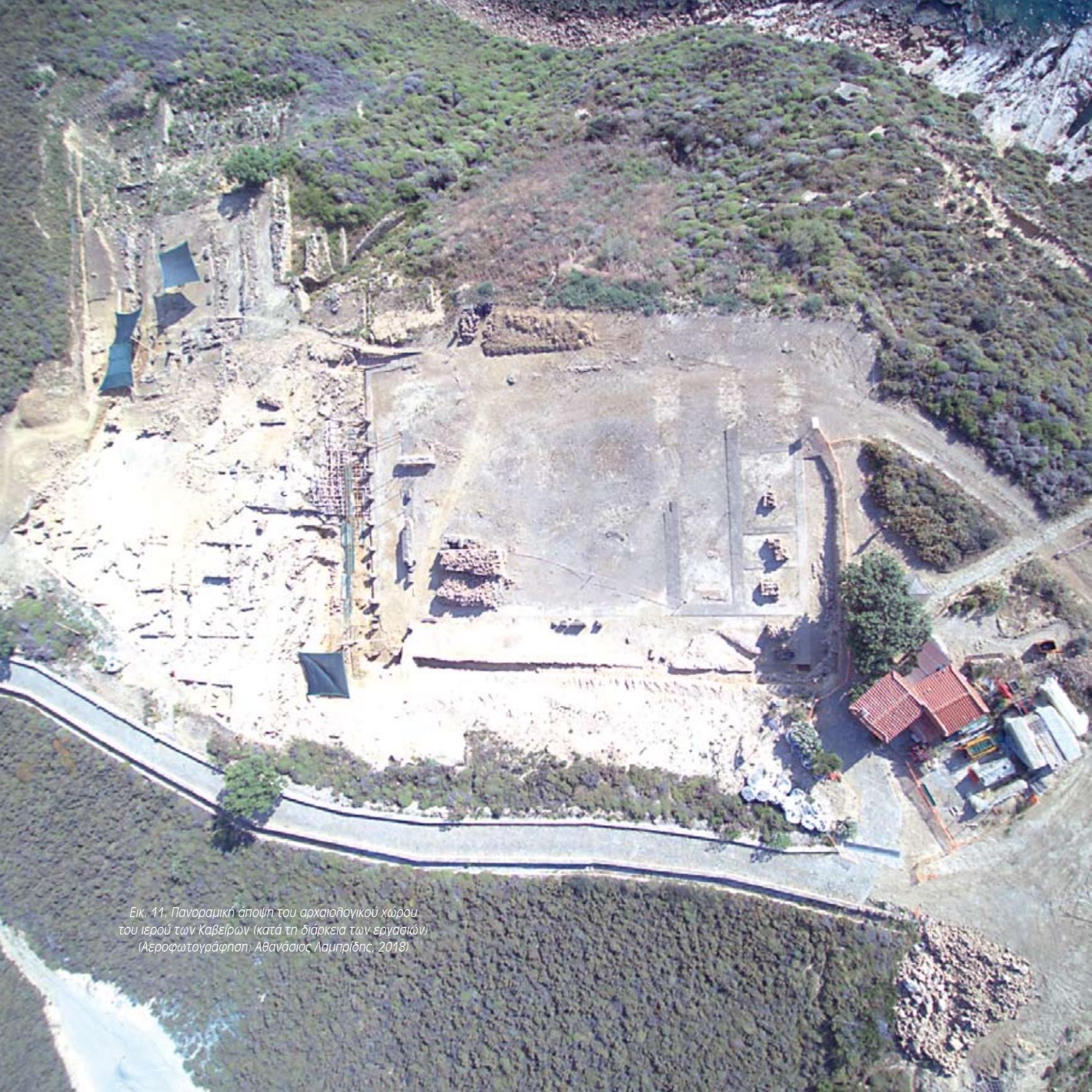
Εικ. 11. Πανοραμική άποψη του αρχαιολογικού χώρου του ιερού των Καβείρων (κατά τη διάρκεια των εργασιών)