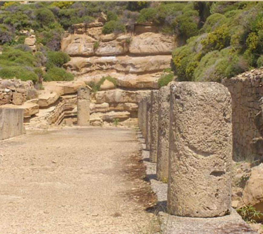
Νότια κιονοστοιχία του Ελληνιστικού Θεάστριου. Άποψη από Δυτικά.