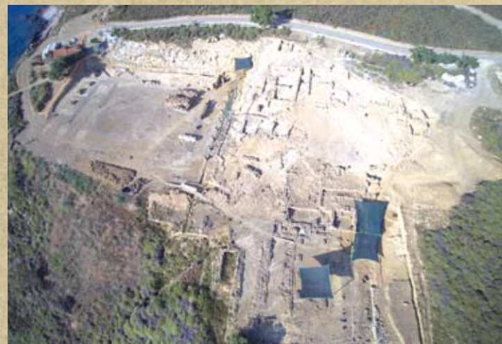
Εικ. 6. Πανοραμική άποψη του ελληνιστικού και υστερορωμαϊκού Τελεστηρίου. Κατά τη διάρκεια των καθαρισμών. Άποψη από Δυτικά