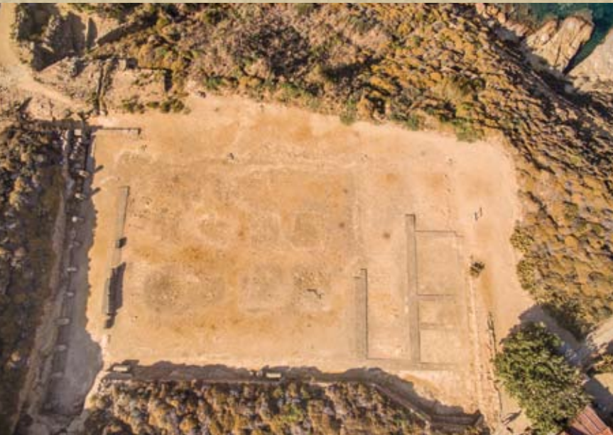
Εικ. 4. Αεροφωτογραφία του Ελληνιστικού Τελεστηρίου. Άποψη από Ανατολικά (Αεροφωτογράφιση: Παύλος Αβαγιανός, 2016)

δος του κτιρίου βρισκόταν στη νότια πλευρά και είχε πρόναο με επτά κίονες. Η κεντρική αίθουσα, μήκους 17 μ., ήταν χωρισμένη σε τρία μέρη από δύο σειρές πέντε κίωνων. Τα δύο πλευρικά τμήματα είχαν μεγαλύτερο μήκος από το κεντρικό, με θρανία τουλάχιστον κατά μήκος του νότιου τοίχου. Ένας διάδρομος χώριζε την κεντρική αίθουσα από τα άδυτα που βρι-