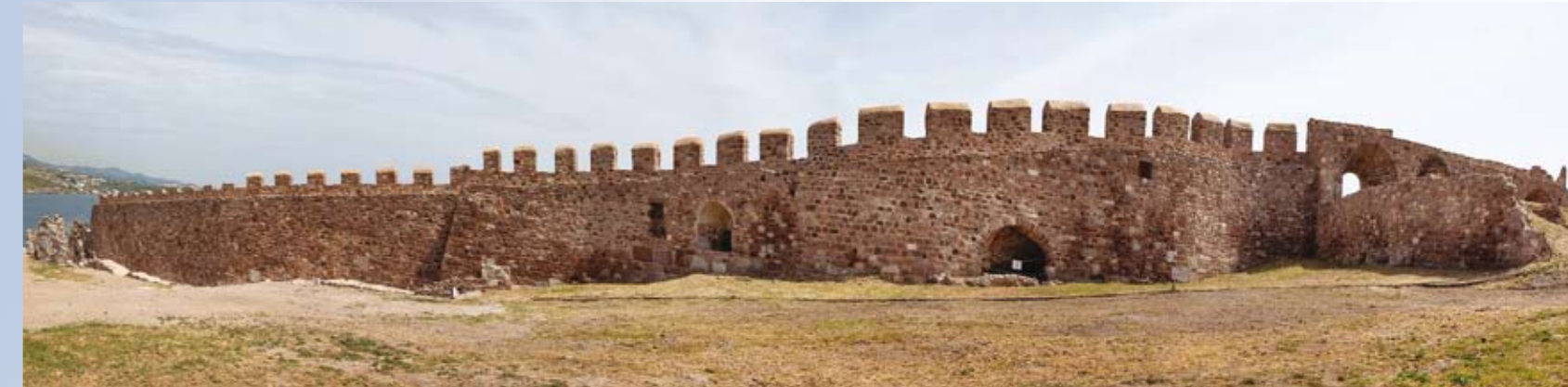
3. Πανοραμική φωτογραφία της εσωτερικής παρειάς του ΒΑ περιβόλου (περιοχές Α και Β)